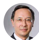
Kairat Abdrakhmanov Minister of Foreign Affairs