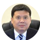
Marat Beketayev Minister of Justice