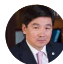
Bauyrzhan Baibek Akim of Almaty