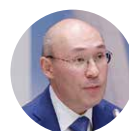
Kairat Kelimbetov Governor, Astana International Financial Center