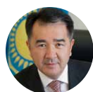
Bakytzhan Sagintayev Prime Minister