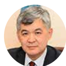
Elzhan Birtanov Minister of Healthcare