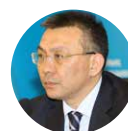
Ardak Tengebayev Chairman of state revenue committee of RK