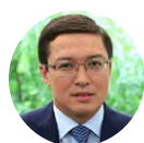
Daniyar Akishev Governor of the National Bank of RK